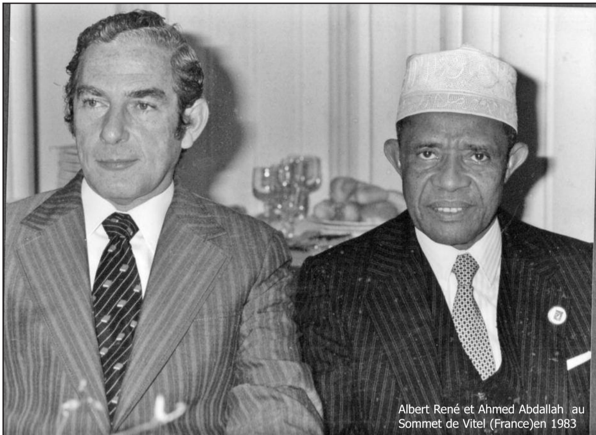
Albert René et Ahmed Abdallah au Sommet de Vitel (France) en 1983

Un an après l'indépendance des Seychelles, M. René, alors Premier ministre, renverse en 1977, le premier président du pays, James Mancham, lors d'un coup d'État sans effusion de sang, et fait de l'archipel un pays socialiste à parti