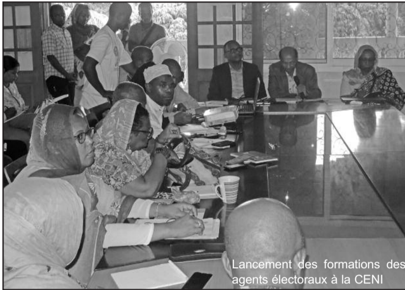
Lancement des formations des agents électoraux à la CENI